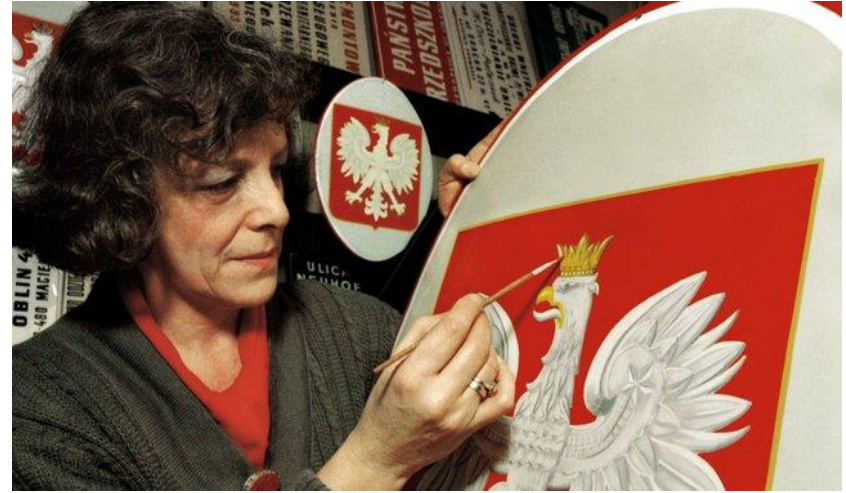
Domalowywanie korony orłom w warszawskim zakładzie szyldów i tablic (styczeń 1990).