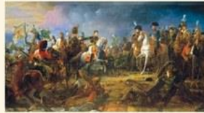
Bitwa pod Austerlitz , która rozegrała się 2 grudnia 1805 roku, została przedstawiona przez XIX-wiecznego francuskiego malarza François Gérauda (czytaj: fransuła żerarda). Jest nazywana „bitwą trzech cesarzy”, ponieważ brały w niej udział armie cesarza Francji Napoleona, cesarza Austrii Franciszka I oraz cara Rosji Aleksandra I.

Grenadier francuski to żołnierz doborowych oddziałów piechoty. Grenadierzy w armii Napoleona byli uzbrojeni w karabiny z bagnietami i tasaki.