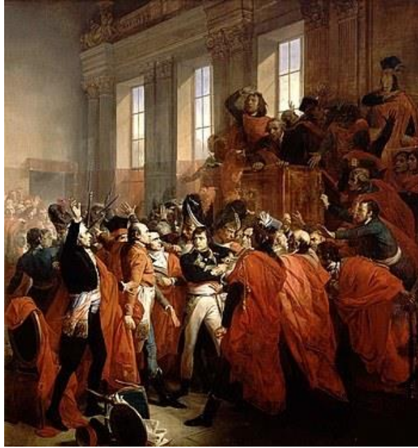
1 - Napoleon ogłosił koniec rządów dyktatoratu. Obraz z XIX w.