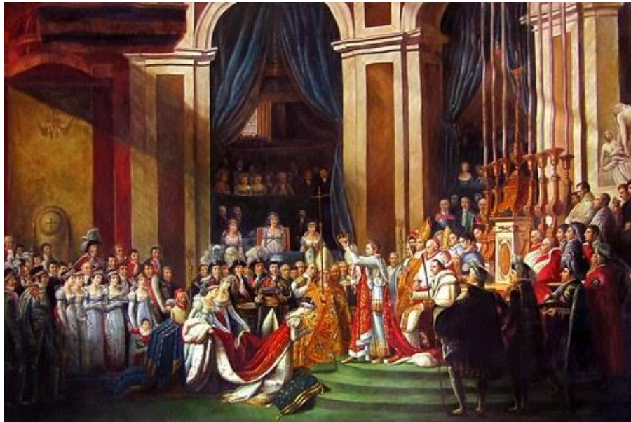
2 - Koronacja Napoleona Bonaparte

Pod koniec 1804r. w Paryżu odbyła się koronacja Napoleona Bonaparte na Cesarza Francuzów.