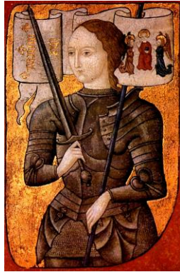
Joanna d'Arc to najsłynniejsza w średniowieczu kobieta-rycerz

Właściwie wszyscy średniowieczni rycerze to mężczyźni. Dawne zwyczaje nie pozwalały, by kobiety pełniły służbę rycerską. Zdarzały się jednak wyjątki. Przykładem kobiety-rycerza jest Joanna d'Arc [wym. dark] , która żyła w pierwszej połowie XV w. Stała na czele wojsk francuskich i dzielnie walczyła przeciw Anglikom.